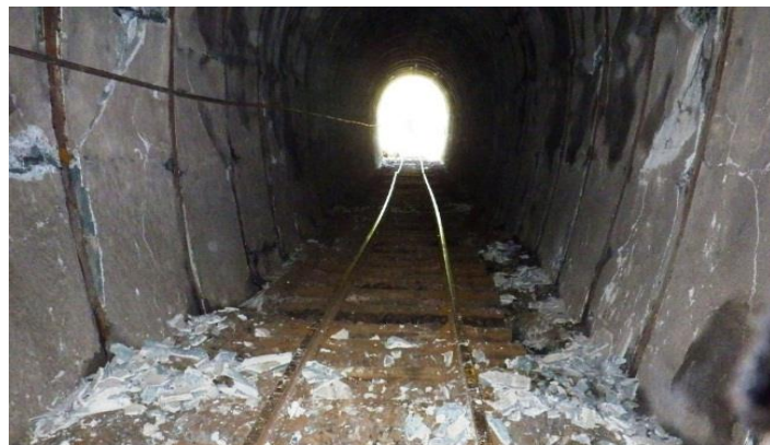
天井・壁面が崩落した犀角山トンネル