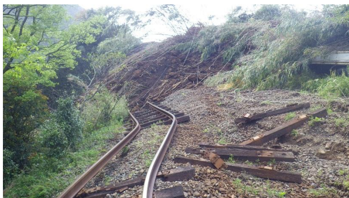
土砂崩れによる線路流出