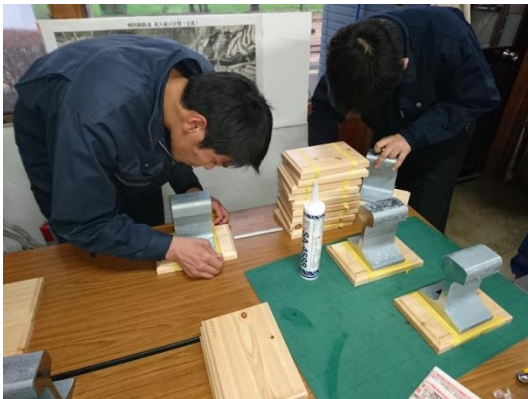
南阿蘇鉄道(株)の職員による制作風景

熊本県南阿蘇村 さとふる 納税サイト https://www.satofull.jp/vill-minamiaso-kumamoto/