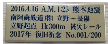
シリアルナンバー入りメモリアルプレート