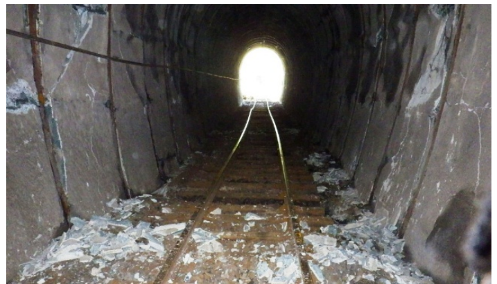
天井・壁面が崩落している犀角山トンネル