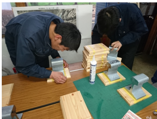
南阿蘇鉄道(株)の職員による制作風景

熊本県南阿蘇村 さとふる 納税サイト https://www.satofull.jp/vill-minamiaso-kumamoto/