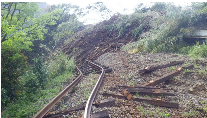
土砂崩れによる線路流出