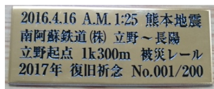
シリアルナンバー入りメモリアルプレート